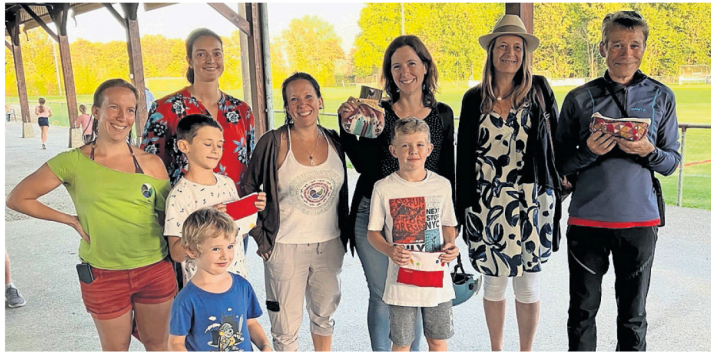
Les lauréats du quiz avec les créatrices de la Vadrouille et les représentantes de la Mairie. OLIVIER LOMBARD

La météo était idéale en ce samedi 7 octobre pour le programme que la Commune de Choulex avait concocté en relation avec l'environnement. Et c'est une assistance nombreuse qui s'est retrouvée pour inaugurer la Vadrouille que l'association Naries a créée dans la campagne choulésienne. Il s'agit d'un parcours pédestre, ponctué d'étapes où l'on trouve un code QR à scanner au moyen de son téléphone portable. On accède alors à une