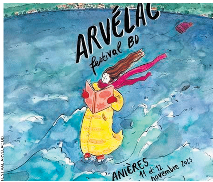
Détail de l'affiche de Fanny Vaucher pour l'édition 2023.

Le Festival Arvélac BD, c'est samedi 11 novembre de 10 h à 18 h et dimanche 12 novembre de 10 h à 17 h.