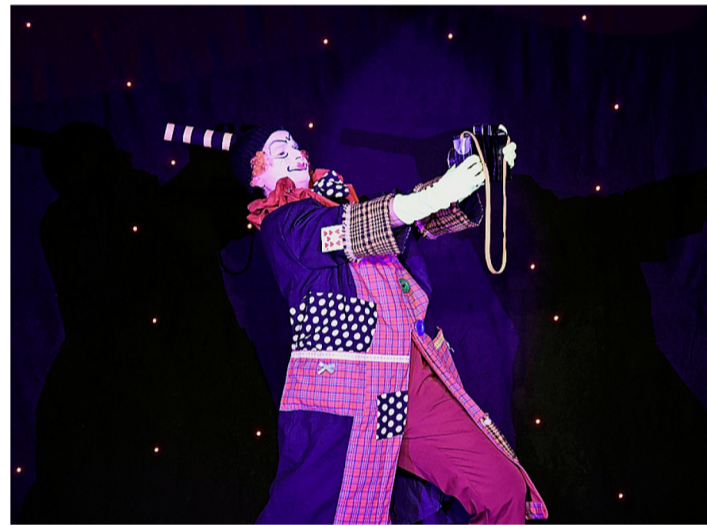
Un beau moment de poésie avec la clown. FABRICE CORTAT

sur pied non seulement un spectacle comprenant des sketches, du chant, de la danse et de l'effeuillage, tout en suivant une trame qui se déroule durant toute la soirée, mais en plus de servir un délicieux repas avec entrée, plat principal et dessert pour une centaine de personnes. Le ballet des serveuses, serveurs, sommeliers et sommelières assure un service rapide et efficace, qui implique qu'en cuisine on soit prêt à dresser 100 assiettes au bon moment. Le rythme de la soirée est donc soutenu, et les spectateurs peuvent en profiter dans les meilleures conditions. Cela signifie une organisation rigoureuse, un enga-